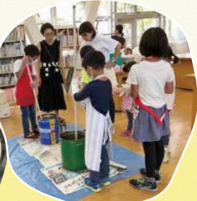
講座講師・編集・環境など

W.Coは、出資・経営参画・労働が一体になった、働く人の協同組合。経営も働き方も、みんなで意見を出し合って決めるのが特徴です。